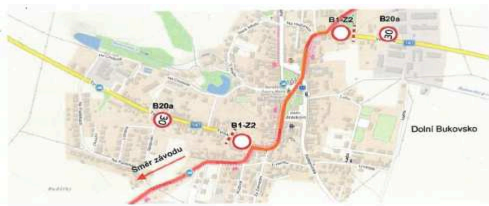
Situace č. 19