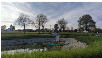
Čistička odpadních vod Horní Bukovsko