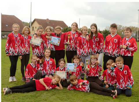
Na letošním Plameni v Dřitní jsme byli bronzová