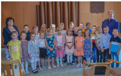
Slavnostní přivítání prvňáčků

Krásný čas plný pohody vám přeje vaše starostka.