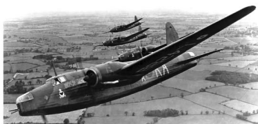
Bombardér Wellington 311. československé peruté RAF