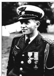
Generál František Peřina legendární pilot z 2. sv. v.

Na začátku jsem napsala, že nevím, proč se učíme dějepis. Teď už to vím. Dějepis se učíme proto, abychom nezapomněli na to, co se dělo a díky komu teď máme lepší budoucnost.