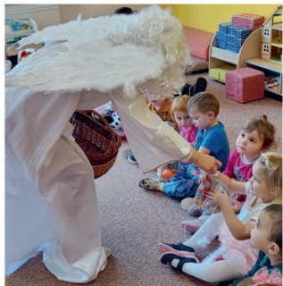
Mikulášská nadílka u Berušek