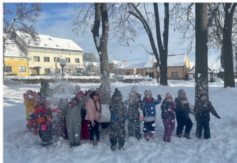
Kočky si užívají sněhové radovánky