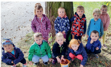
Berušky sbírají kaštiny při dopolední procházce.