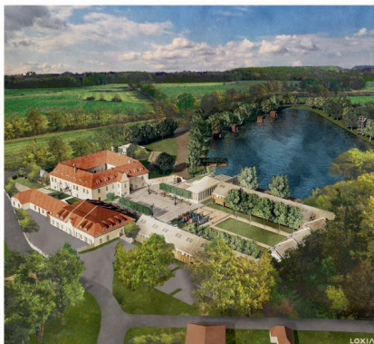
Panství Bzí jako na dlani

A co ze zámku bude? Podle slov majitelů se můžeme těšit na víceúčelový relaxační areál zahrnující zámecký hotel, společenský sál, restauraci, wellness nebo zámecké zahrady pro konání svateb či rozhlednu s vyhlídkou na rybník. „V případě zámku využijeme toho, že zámek žil kolem středového patia. Všechny místnosti budou přístupné z terénu nebo ochozu,“ doplňuje inženýr Hendrych.