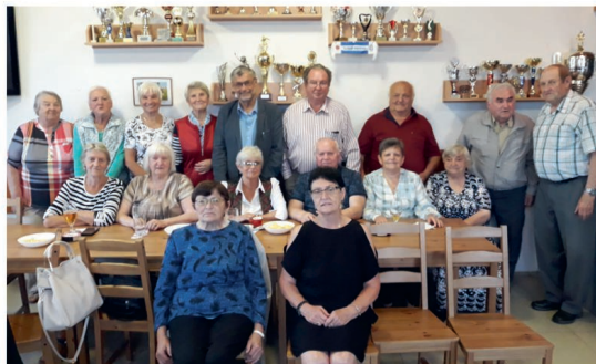
Ze setkání absolventů bukovské školy